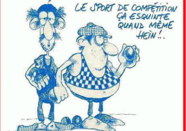
LE SPORT DE COMPÉTITION ÇA ESQUINTE QUAND MÊME HEIN !..