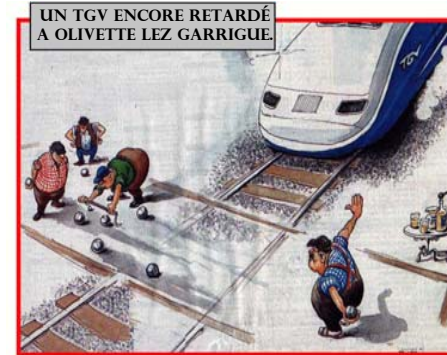
UN TGV ENCORE RETARDÉ A OLIVETTE LEZ GARRIGUE